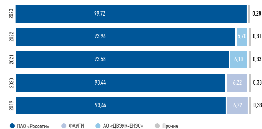
Структура акционерного капитала ПАО «Россети Кубань» за 2019–2023 годы (%)

сетевая компания — Россети» (сокращенное наименование — ПАО «Россети», ранее — ПАО «ФСК ЕЭС»). Последнее является универсальным правопреемником перечисленных организаций, к нему перешло право собственности на все акции ПАО «Россети Кубань», принадлежавшие указанным акционерам Общества.